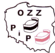
Ogólnopolski Związek Zawodowy Pielęgniarek i Położnych Regionu Podkarpackiego